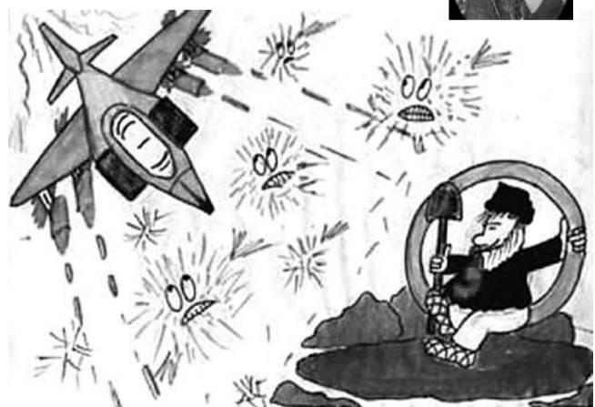
А вот таким детским «видением» браздов, ямщика и кибитки делятся друг с другом пользователи Интернета