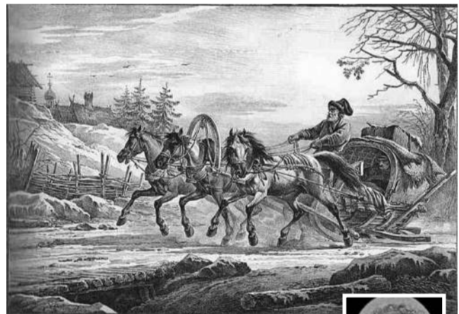
Настоящая кибитка — это крытая повозка, как на этой литографии Александра Орловского «Путешественник в кибитке, или Сани, запряжённые тройкой» (1819, Киевская картинная галерея)

Другие ученики назвали кибитку «птичкой», летящей с Кубы и крыльями поднимающей снег; «поездом, который очень быстро едет, и поэтому снег летит вверх и вниз» и даже «кибернетической, шустрой тёткой». Ямщик, по их мнению, оказался «дядей, профессия которого — таскать ящики»; человеком, роющим ямы, вероятно, карликом, «потому что сидит на чём-то маленьком и прячется в ямку».