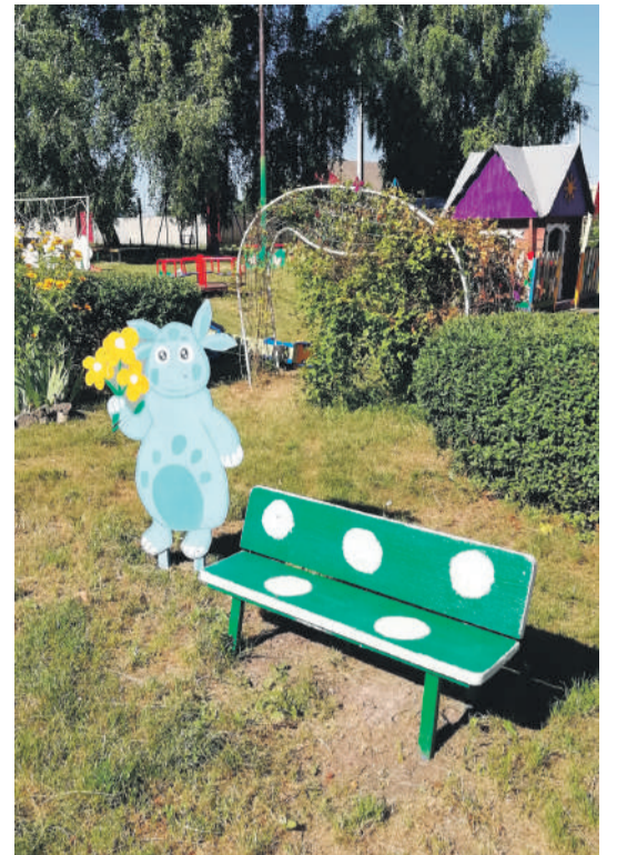
Детсад № 4 с. Алексеевка Корочанского района