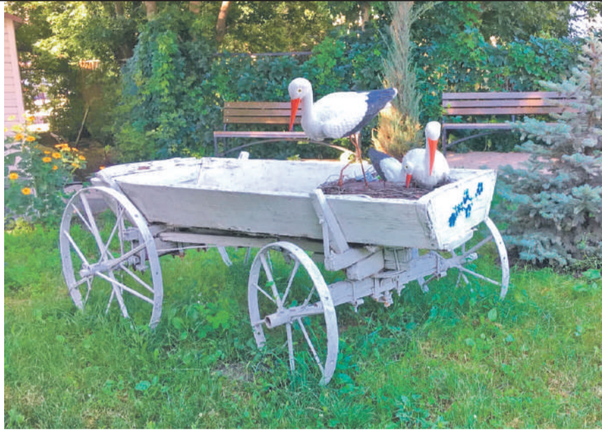
Центр образования № 1 г. Белгорода