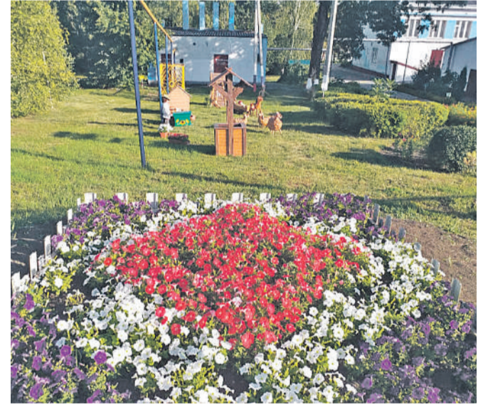
Старобезгинская школа Новооскольского городского округа